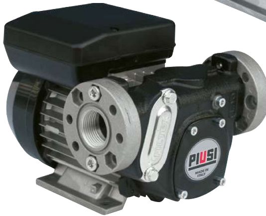
PANTHER 72 - PANTHER 90 (bride inclus)