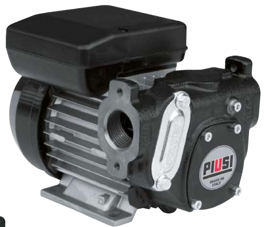
PANTHER 56 (bride non inclus)